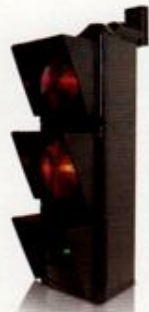
چراغ راهنمایی ریپیتر ۱۰ سانتیمتری