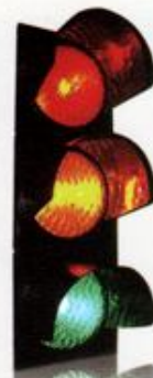
چراغ راهنمایی ۳۰ سانتیمتری لامپی