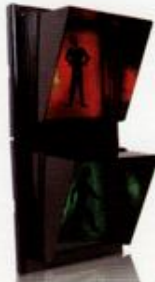
چراغ راهنمایی عابر پیاده لامپی