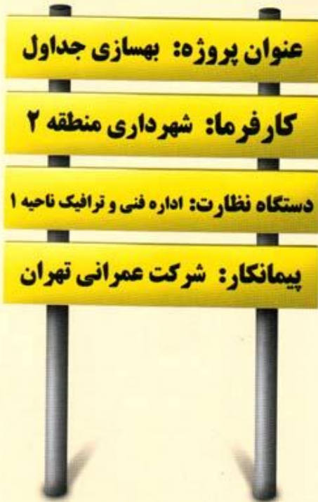
تابلوهای مخصوص پروژه‌های عمرانی