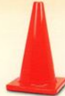
مخروطی ترافیکی ۶۰ سانتیمتری