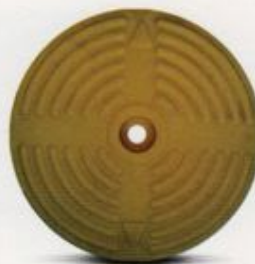
گل میخ دایره شکل قطر ۲۰ سانتیمتری