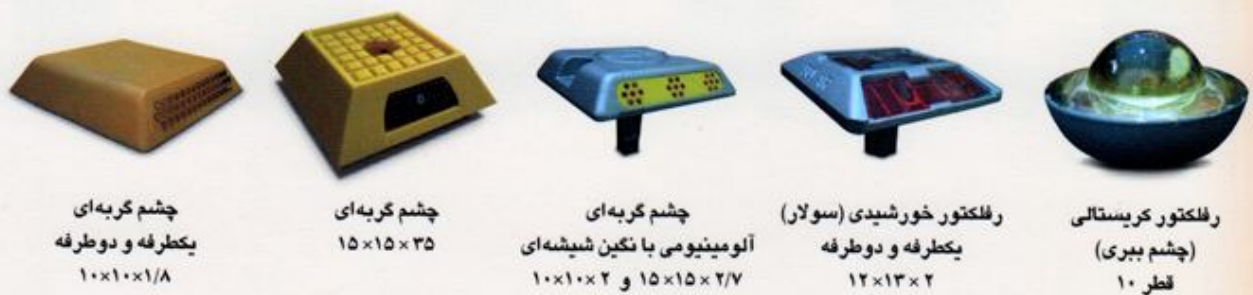
چشم گریه ای یکطرفه و دوطرفه ۱۰×۱۰×۱/۸