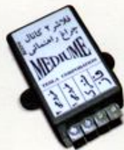
فلشر ۲ کانال چراغ راهنمایی