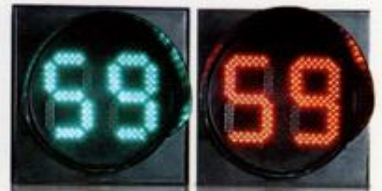
شمارنده معکوس ترافیکی ۳۰ سانتیمتری