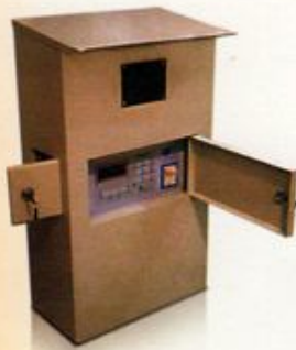
دستگاه فرماندهی چراغ راهنمایی