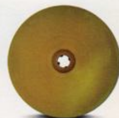
گل میخ دایره شکل قطر ۱۵ سانتیمتری