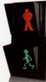
چراغ راهنمایی عابر پیاده LED