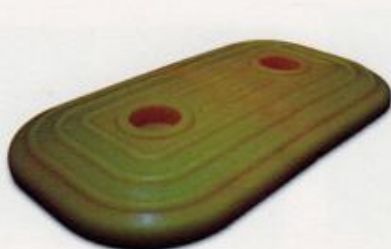
گل میخ مستطیل شکل ۱۵×۲۷