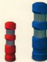
استوانه ثابت ترافیکی