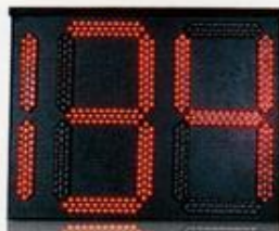
شمارنده معکوس ترافیکی ۶۰×۸۰ سانتیمتری