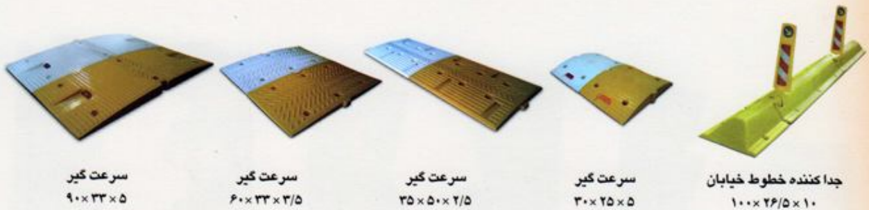
سرعت گیر ۹۰×۳۳×۵