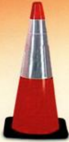
مخروطی ترافیکی ۱۰۰ سانتیمتری