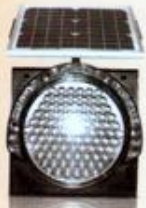
چراغ راهنمایی خورشیدی LED

تابلوهای ترافیکی خورشیدی، در طول روز با استفاده از سلول‌های خورشیدی شارژ شده و در شب نقش بسته شده بر روی آن (همانند یک فلش) با کمک چراغ‌های الکترونیکی موسوم به LED، بصورت چشمک‌زن روشن می‌شوند.