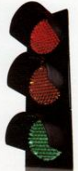
چراغ راهنمایی ۳۰ سانتیمتری LED