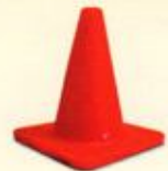
مخروطی ترافیکی ۴۵ سانتیمتری